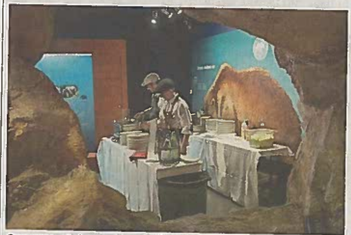
Cena gourmet al museo Ursus ladinicus