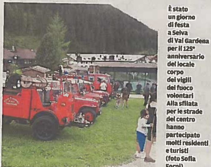
È stato un giorno di festa a Selva di Val Gardena per il 125° anniversario del locale corpo dei vigili del fuoco volontari. Alla sfilata per le strade del centro hanno partecipato molti residenti e turisti