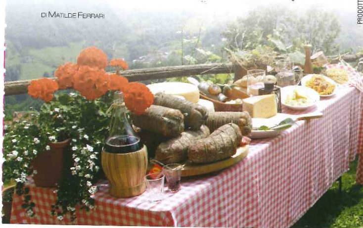
PRODOTTI TIPICI DELLE PICCOLE DOLOMITI VICENTINE