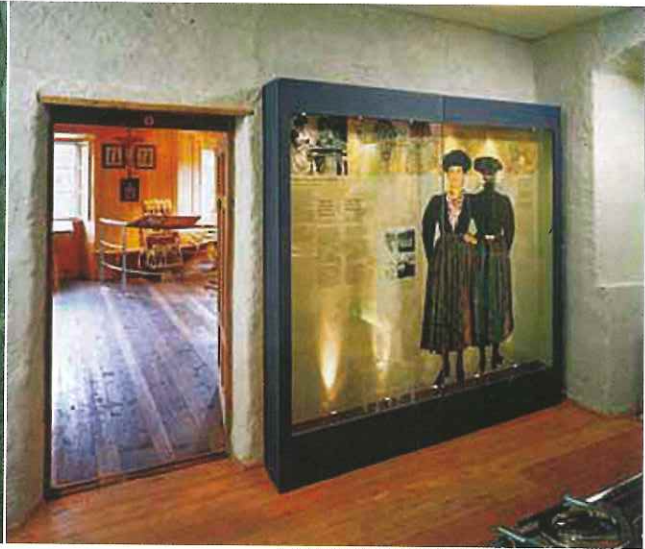
IL COSTUME TRADIZIONALE FEMMINILE DI CORTINA

Verbiz e accoglie le ricostruzioni degli ambienti originali ladini, come la tipica "stube" del mondo contadino e montano caratterizzata dal " mogun ", tradizionale stufa in muratura. Nel Museum Ladin si trovano anche sezioni di grande interesse storico, con l'esposizione di reperti archeologici rinvenuti in diverse zone non solo delle Dolomiti. I resti più carichi di mistero sono le " tavolette enigmatiche " ( Brotlaibidole ), una serie di tavolette di terracotta , la cui forma ricorda una pagnotta, lunghe circa 10 centimetri e larghe circa 5, che riportano segni incomprensibili, simboli o sequenze di numeri. Il significato delle tavolette non è stato ancora scoperto, ma alcune sembrano essere spezzate, e si può pensare che fossero una sorta di "bolle di consegna" che venivano rotte per dimostrare lo scambio di una merce. Oggi, grazie a speciali software e scansioni 3D è possibile mettere