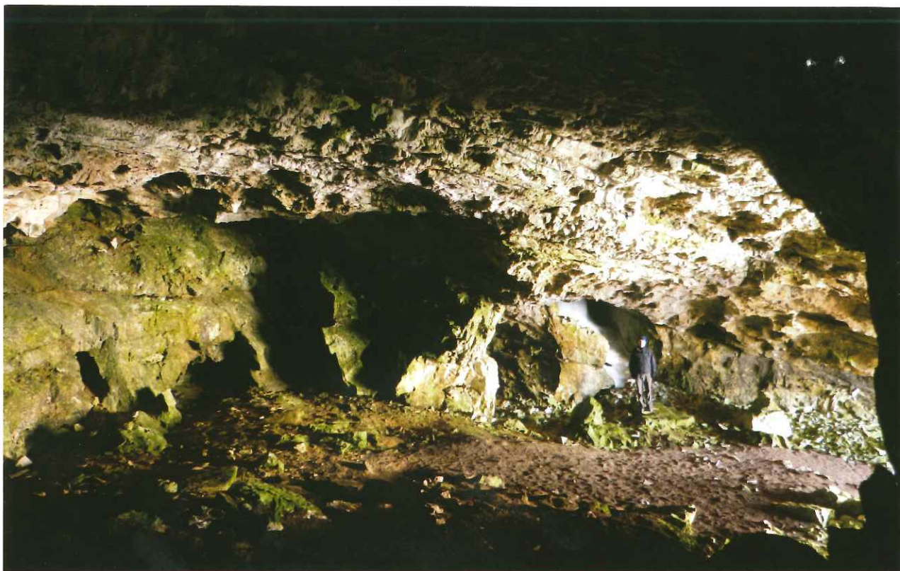
LA GRANDE SALA ALL'INGRESSO DELLA GROTTA DELLE CONTURINES