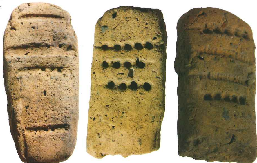
LE TAVOLETTE ENIGMATICHE DI SOTCIASTEL

questi affascinanti reperti a confronto per evidenziarne differenze e analogie. I ritrovamenti sono stati scoperti in un'area archeologica molto estesa, dall'Italia del Nord ai monti Carpazi , fino al Danubio. Sono 334 pezzi , quattro dei quali sono stati rinvenuti proprio vicino alla sede del Museum Ladin, su una collina chiamata Sotciastel . Qui, durante l'età del Bronzo (3.500 anni fa) esisteva un insediamento umano e le tavolette misteriose potrebbero essere una testimonianza della vita di questa comunità.