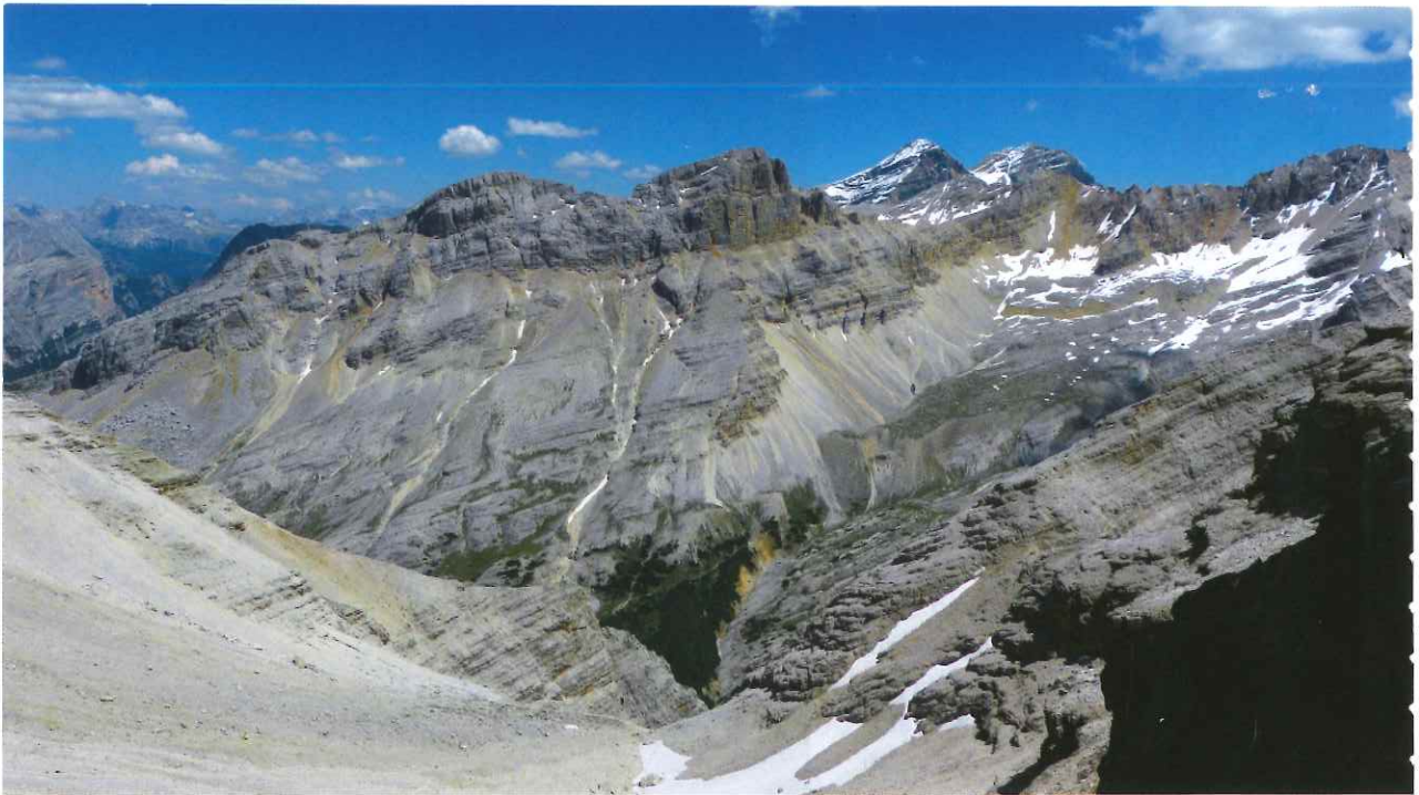
IL PANORAMA MOZZAFIATO CHE SI VEDE DALL'INGRESSO DELLA GROTTA

go l'ampio cunicolo della grotta, dove la temperatura è molto bassa, si arriva infatti a meno di 10 gradi centigradi e anche d'estate il freddo si fa sentire. Il senso dell'orientamento e la percezione temporale si fermano e ci si sente catapultati indietro di migliaia di anni. La visita è resa ancora più emozionante dall'incontro con due enormi stalagmiti simboliche, " I vardian " - il guardiano della " Sala dei crani " - e la " Rajëta ", presso la quale sono stati trovati i crani fossilizzati dell'orso. Tutt'intorno a questa stalagmite le femmine partorivano i loro cuccioli e d'inverno gli animali riposavano durante il letargo, che poteva durare anche sei mesi. Visitando la grotta è ancora possibile imbattersi in qualche resto degli orsi, che però deve obbligatoriamente rimanere all'interno della grotta.