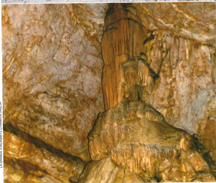
LA GRANDE STALAGMITE CHIAMATA RAJETA