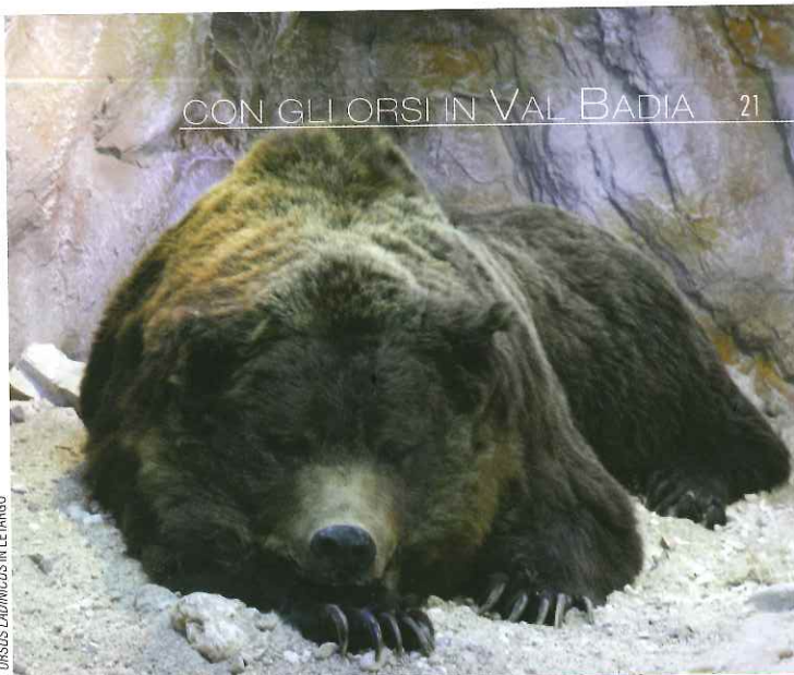
L'URSUS LADINICUS IN LETARGO