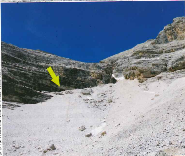
L'ENTRATA DELLA GROTTA IN MEZZO ALLA PARETE ROCCIOSA DELLE CONTURINES